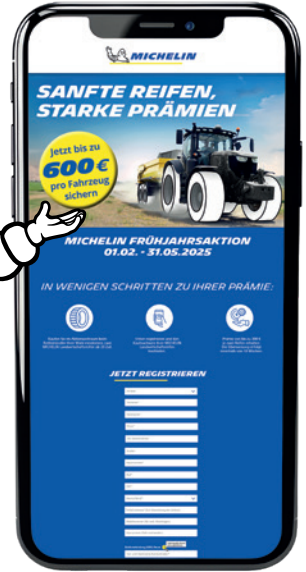
Abbildung und Inhalte ähnlich